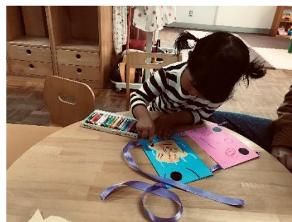
～こいのぼり製作をしました～