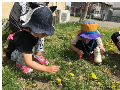
～お友達とたんぽぽやてんとう虫 を見つけました～

4月は新しいお友達も遊びに来てくださいました。5月もいろいろな活動を行いたいと思いますので、ぜひ遊びに来てください。また、お知り合いの方がいましたらお誘いいただけたらと思います。